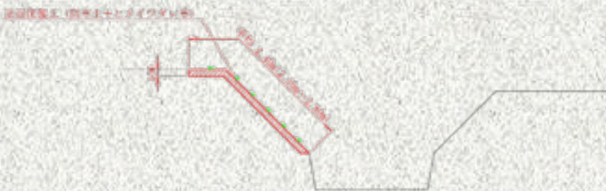
法面保護工標準断面図